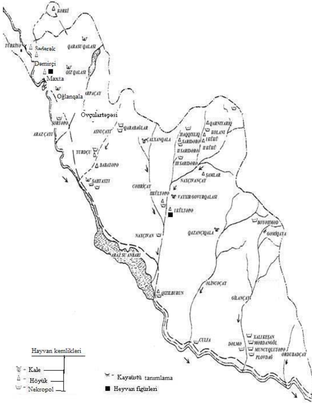
Tablo II. Nahçıvan Özerk Cumhuriyeti topraklarındaki yerleşimlerden hayvanlarla ilgili bulunmuş arkeolojik bulgular.