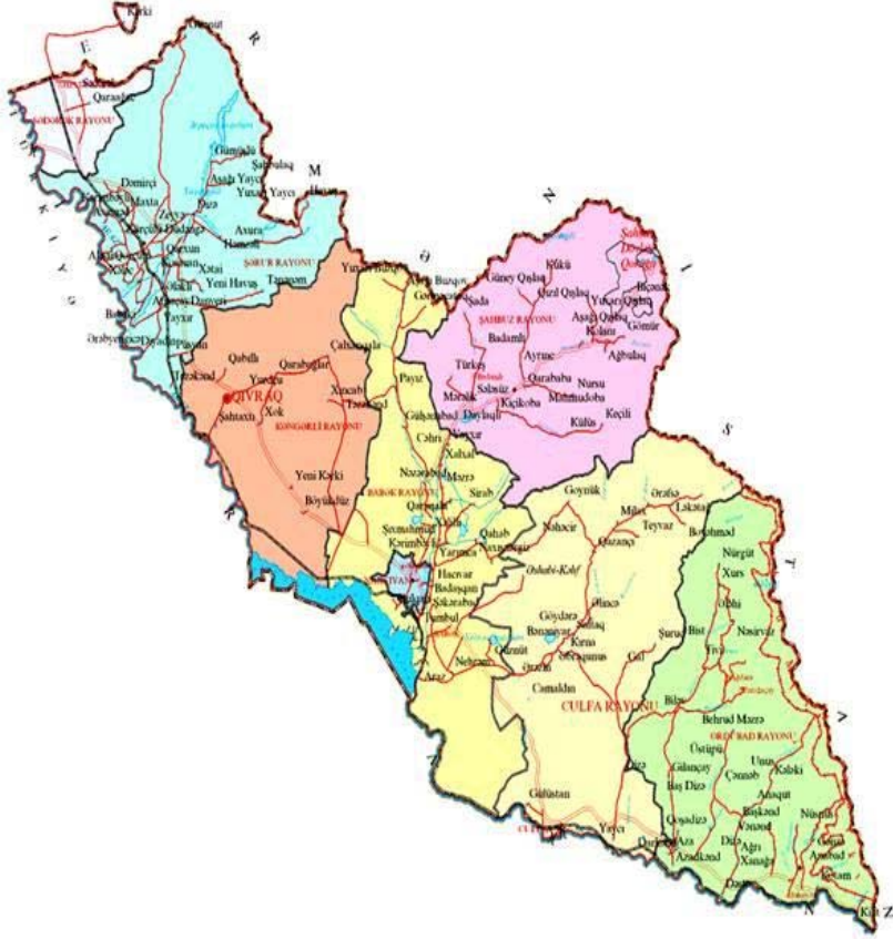
Tablo I. Nahçıvan Özerk Cumhuriyeti'nin Haritası.