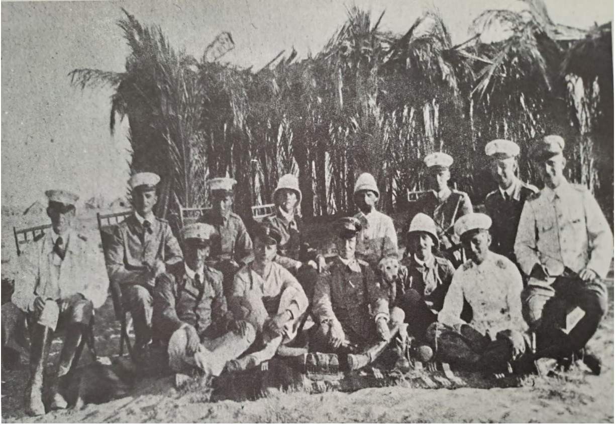
Ek-3: El-Ariş'te Paşa I (300.) Tayyare Bölüğü: Oturanlar Soldan Sağa İkinci Sırada Ütğm. Bülow, Üçüncü Yzb. Heemskrek, Dördüncü Yzb. Henkelburg ve Ütğm. Felmy. (Flanagan, "The Reports of Erich Serno 1", s. 134)