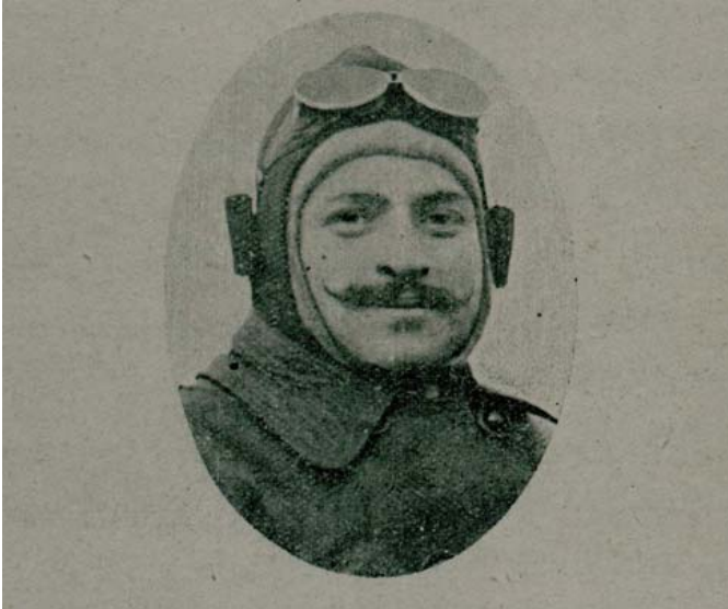
Talebe Defteri, Nr. 21, 27 Şubat 1329/12 Mart 1914, s. 341 (Fethi Bey).

Hayatını vatan için feda eden bu vicdanlı kahramanların isimleri yüreklerden asla silinmeyecek, cesaret ve gayretleri milletçe unutulmayacaktır 41 .