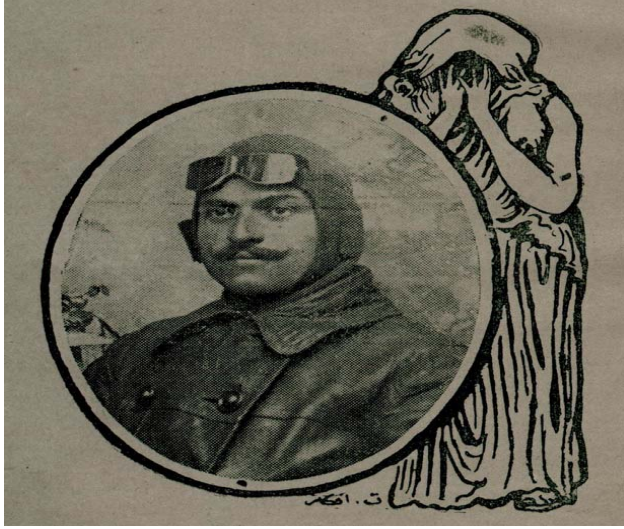
Çocuk Dünyası, S. 50, 20 Şubat 1329/5 Mart 1914, s. 1 (Fethi Bey).

Şiirin devamında Türklük uğruna hayatını feda eden ve şanı ufuklara varan bu şehitlerin yaktığı ateşin her Türkün kalbinde yanacağı, kalplerde bu ateş yandıkça Türklüğün onlara akacağı vurgulanmıştır. Şair en sonunda Türk gençlerine, mezarlarından Türk milletine şan ve şeref saçan ve Türklüğü yükseltmeye çalışan bu yüce erleri unutmamalarını ve mertliklerini kalplerine yazmalarını öğütlemiştir 32 .