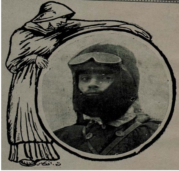
Çocuk Dünyası, S. 50, 20 Şubat 1329/5 Mart 1914, s. 3 (Sadık Bey).

Osmanlı Devleti'nin ilk hava şehitleri haberine yer veren mecmualardan bir diğeri de Mektebli mecmuasıdır. 29 Mayıs 1913 – 23 Nisan 1914 tarihleri arasında toplam 39 sayı çıkan mecmuanın 33 33. sayısında hava şehitlerine hitaben bir makale, bir hikâye, iki şiir ve bir hatıra yer almıştır. Fethi ve Sadık beylere hitaben ve " Mektebli " imzasıyla yazılan makale " Onlar da gitti, üful etti... Onlar da onlar da bu bir senenin felaketler, eninler, vaveylalarla dolu bu senenin dimağ-ı milletten kopardığı, söndürdüğü güneşlere bir zamime oldu. Onlar da semaların, kahkeşanların, yıldızların harim-i ünsiyetine kadar yükselirken vatan için, şeref ve şan-ı millet için şehit oldular. " cümleleriyle başlar. Devamında Fethi ve Sadık beylerin gençlere, ölmez bir cesaret ve bitmez bir kuvvetle Türklüğün ne harikalar doğuracağını, unutulmayacak kahramanlıklarıyla anlattıkları vurgulanmıştır. Onlar, dünün ve yarının müebbet kahramanları olarak gözlerinde vatan aşkı ve kalplerinde zaferle semaların fırtınalarına, boralarına, şimşeklerine göğüs gererek Osmanlı'nın al sancağını yükseltirken dudaklarında bir tebessüm vardı. Şehit olup düşerken ve son bir nazarla al sancağı selamlarken de aynı tebessüm dudaklarındaydı. Şehadetlerinden duyulan üzüntü, onların şerefleri ve kahramanlıkları kadar büyüktür. Kahraman havacıların ölümsüzlüğü ve ebediyen milletin kalbinde yaşayacakları vurgulandıktan sonra makale " ...Türk kanunun, Türk canının, Türk