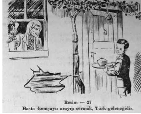
Resim — 27 Hasta komşuyu arayıp sormak, Türk geleneğidir.

Vatanın zarureti Arkin-Su tarafından “Türk yurdu olmasa Türk ulusu olur mu?” 29 ifadesiyle vurgulanmaktadır. Türk vatanı ise Anadolu ve Rumeli topraklarıdır. Bu topraklar ecdadımızın kan dökmek pahasına bize emanet