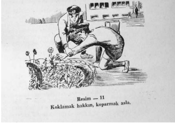
Resim — 11 Koklamak hakkın, koparmak asla.

“Eski Türklerde de demokrasi idaresi vardı. Bütün büyük işler halk toplantılarında görüşülür ve karara bağlanırdı... Demek ki, Türklere ta ilk zamanlardan beri milletin kuvvetine dayanır, millî egemenliği her şeyin üstünde tutardı.” 105 Demokrasinin vazgeçilmez unsurlarından biri ise seçimdir. “...Medeni insanların en belli vasıfları yurttaşı oldukları memleketin milletvekili seçimlerine ve hemşerisi oldukları şehir ve kasabanın belediye seçimlerine, oturdukları köy ve mahallenin ihtiyar heyeti seçimlerine katılmasıdır...” 106 “Seçimlerle oy veren her vatandaş memleketine karşı bir sorumluluk da yüklenmiş olur. Çünkü verdiği oylarla kendi adına iş görece kimseleri kendisi seçmiş olur. Bu sebeple seçim hak ve hürriyetlerini kullanırken yalnız memleketin umumi menfaatlerini göz önünde bulundurmak ve bunu en iyi yapacağını inandığı kimseleri seçmek lazımdır.” 107 “Yurttaşlar seçimlere katılmazlarsa devlet idaresi layık olmayanların, fırsatçıların eline düşebilir. Bu hal kötü sonuçlar doğurabilir... Seçmen olan her yurttaş seçim günü oy kullanmayı millî bir borç saymalı, her engeli yenerek sandık başına gitmeli, değerine inandığı kimseye oyunu vermelidir.” 108