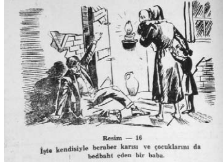
Resim — 16 İşte kendisiyle beraber karısı ve çocuklarını da bedbaht eden bir baba.

Herkes öğrenciden bu nezaket ve insanlığı bekler.