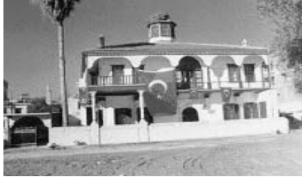
Ek-4; Gazi Mustafa Kemal Paşa'nın Silifke'yi ilk ziyaretlerinde misafir edildiği Hacı Hulusi Efendi Konağı. Silifke Atatürk Evi ve Müzesi.