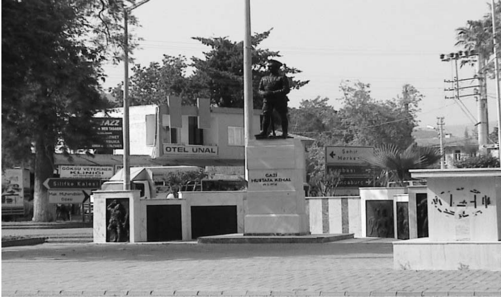
Ek-1: Gazi Mustafa Kemal Paşa'nın Silifke'ye 19 Mayıs 1934 tarihinde dikilmiş olan anıtı.