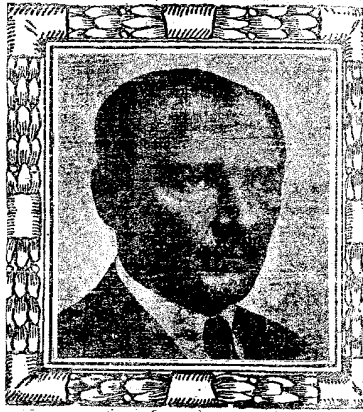
رئیس جہود غازی پاشا حضرت تازی

بووک خلاصکارین غازی پاشا تازی ایکشنی دئمہ اولوق ولایتزوم دوسماد بشش ایندیلر . کین سنہ کارون تاپانک یکری بدشی کونی بو مستکتا سوپنج وختیارانی این سلفکک جمعی بو کون عین جسدین دوغان حقیق پارامک سنا تیزه کامران بوتوزور . برهفتدیری یک تشریف ایدمکچکی خشر آلان رک مسعود برهبرسزلفه کین عرفه رزی ایدنه بوکون بو عالی ولفطکاک نمایه الی بوکین برسدیر وختیارانی نجل اییزور . عجود لایندہ ویتھور اولان بوہجوم