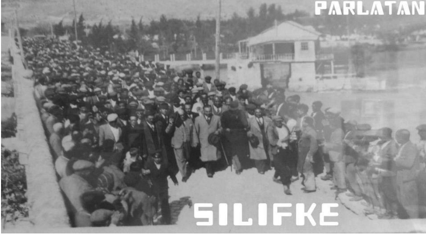
Ek-3; Gazi Mustafa Kemal Paşa Silifke'ye gerçekleştirdiği 27 Ocak 1925 tarihli ilk ziyaretinde kendisini karşılayan Silifkelilerle Tarihi Taş Köprü'den geçerken.