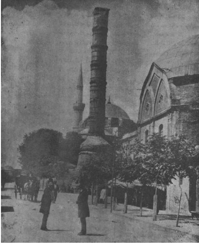
Çemberlitaş 1891 Servet-i Fünûn Dergisi