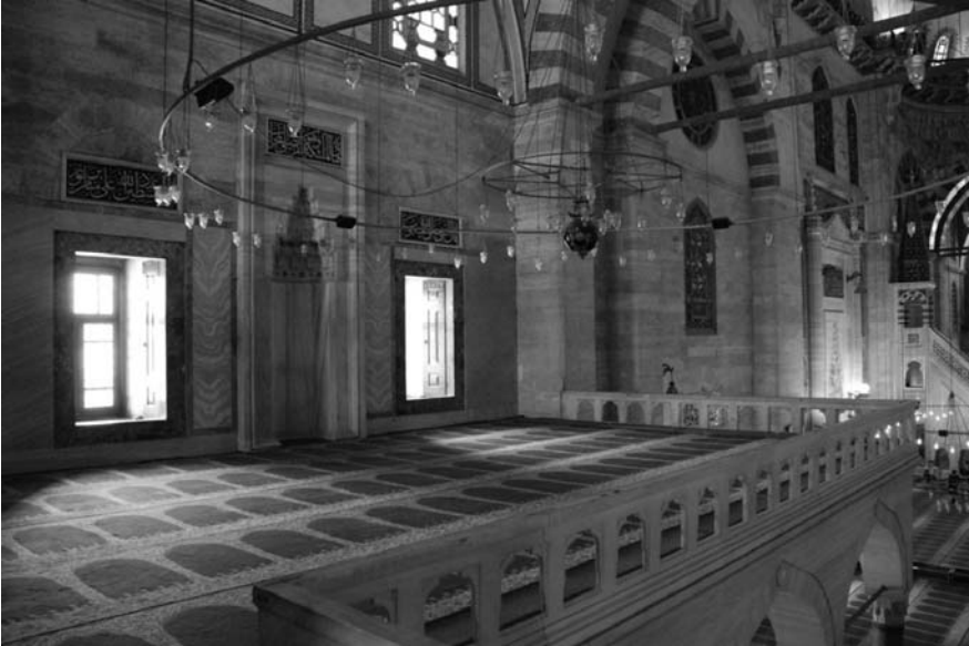
2. Fotoğraf: İstanbul Süleymaniye Camisi hünkâr mahfilinin genel görünüşü ve mihrabiyesi.