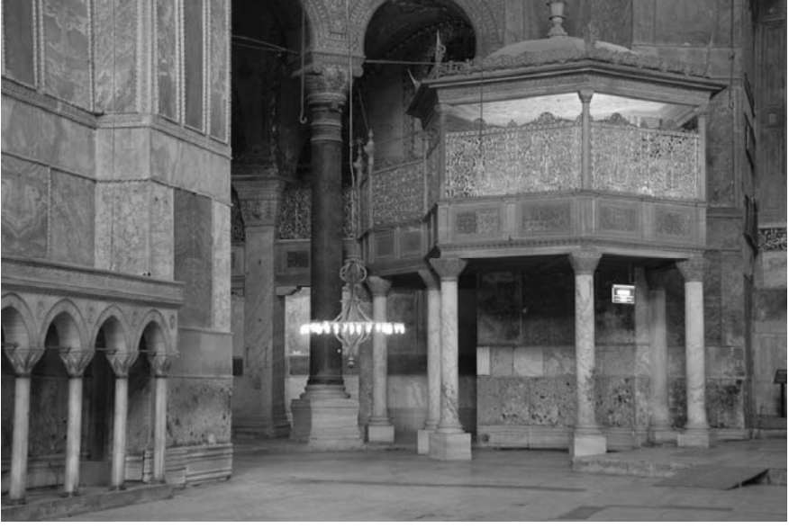
5. Fotoğraf: İstanbul Ayasofya Camisi hünkâr mahfilinin genel görünüşü.