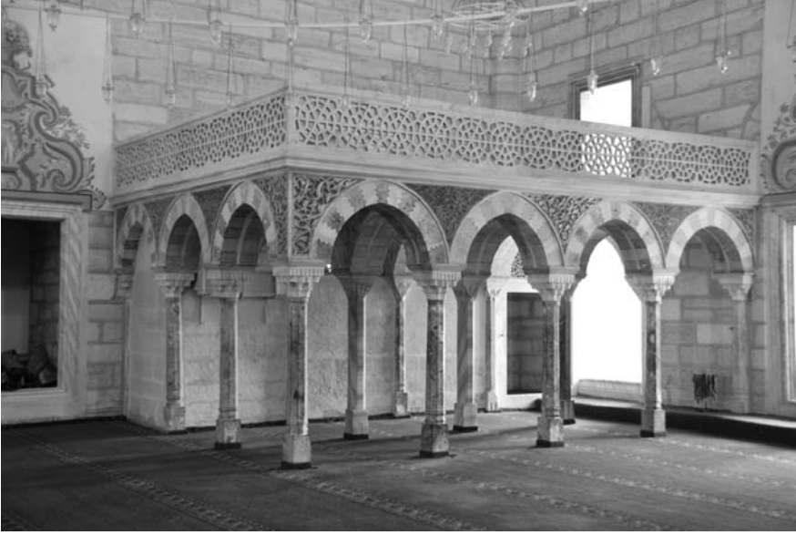
1. Fotoğraf: Edirne 2. Bayezid Camisi hünkâr mahfilinin genel görünüşü.