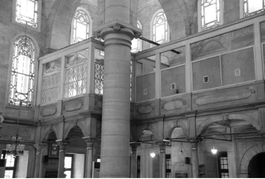
4. Fotoğraf: İstanbul Eyüp Sultan Camisi hünkâr mahfilinin genel görünüşü.